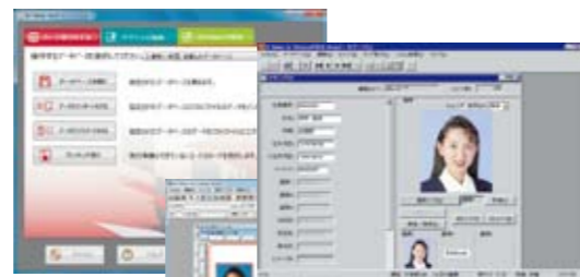
カード発行ソフト ID Maker