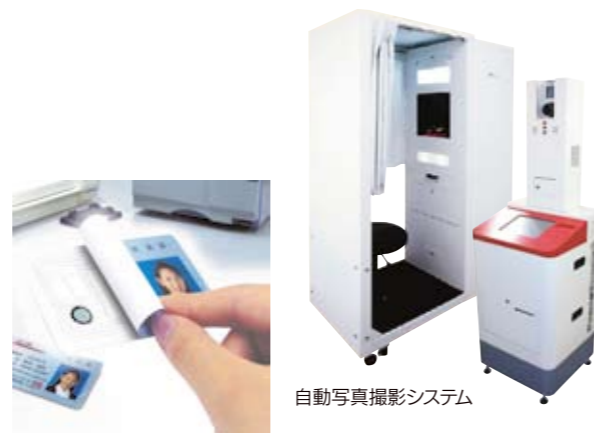
自動写真撮影システム